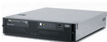
HiPath 8000 V3.1-Server

Jeder Server verfügt über zwei (2) 3,2 GHz Intel-Xeon-Prozessoren, bis zu 16 GB DDR2-Arbeitspeicher, zwei (2) L2/L3-Ethernet-Switches und acht (8) 10/100/1000 Base-T-Ethernet-Verbindungen, eingerichtet als Verbindungspaare zu den Ethernet-Switches (für eine redundante Konfiguration sind zwei externe L2/L3-Ethernet-Switches erforderlich).